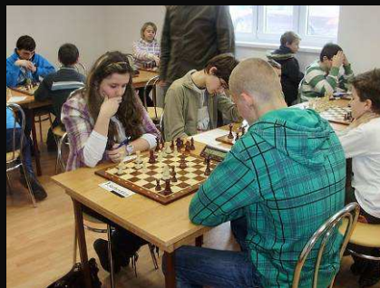
Doprastav A -Lokomotíva