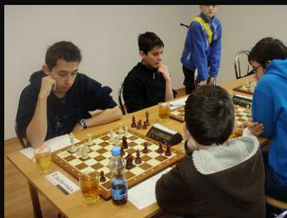
D.Streda - Doprastav B 4:0