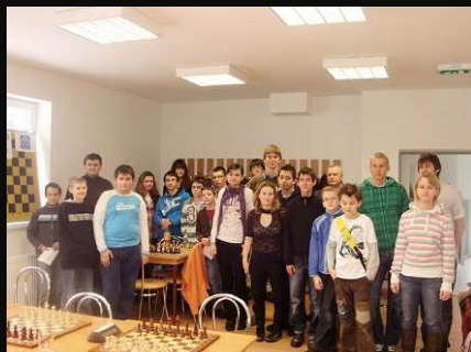
Spoločná fotografia družstiev