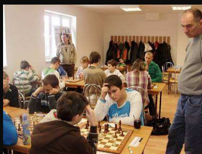
Doprastav B - Modranka 0,5:3,5