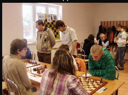
Doprastav A -Lokomotíva 1:3