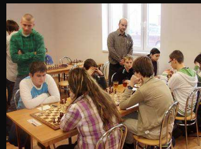
Modranka-Doprastav A 2,5:1,5