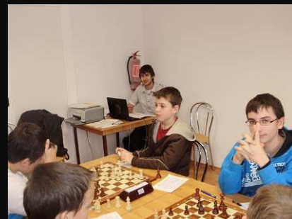
Modranka-Doprastav B 3,5:0,5