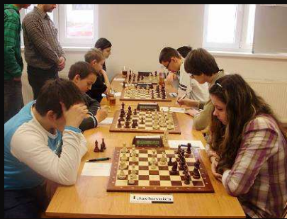
Modranka-Doprastav A 2,5:1,5